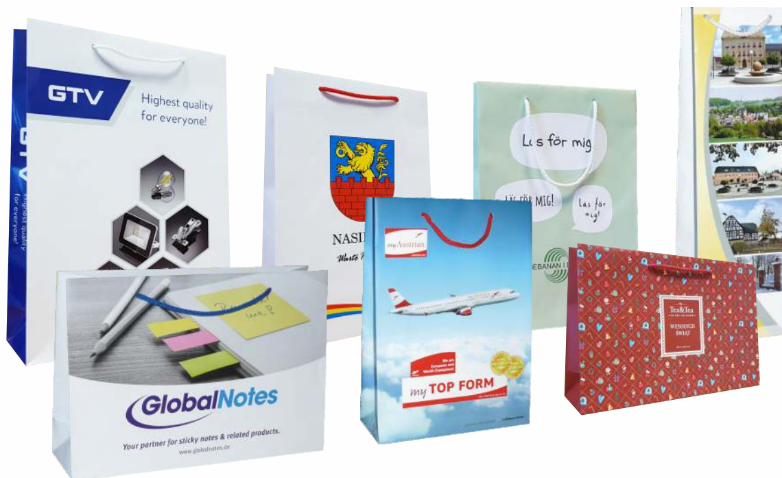
Kolorystyka toreb pod sitodruk (na zamówienie)

Nakłady druk offsetowy od 100 szt. w zależności od formatu torby, sitodruk i cyfra od 50 szt.